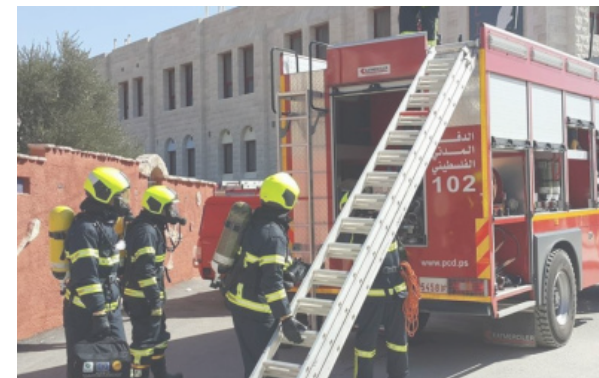
عدة إصابات بانفجار مولد في حرم جامعة الخليل