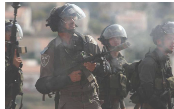
الاحتلال يقتحم روضة أطفال بالطيبة ويفتش حقائبهم