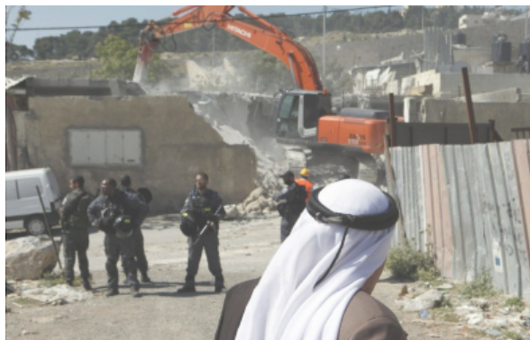
الاحتلال يهدم بركسا للخيل في جبل المكبر