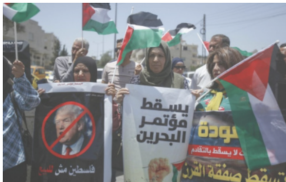
عمان: مؤتمر وطني أردني فلسطيني لرفض "صفقة القرن"