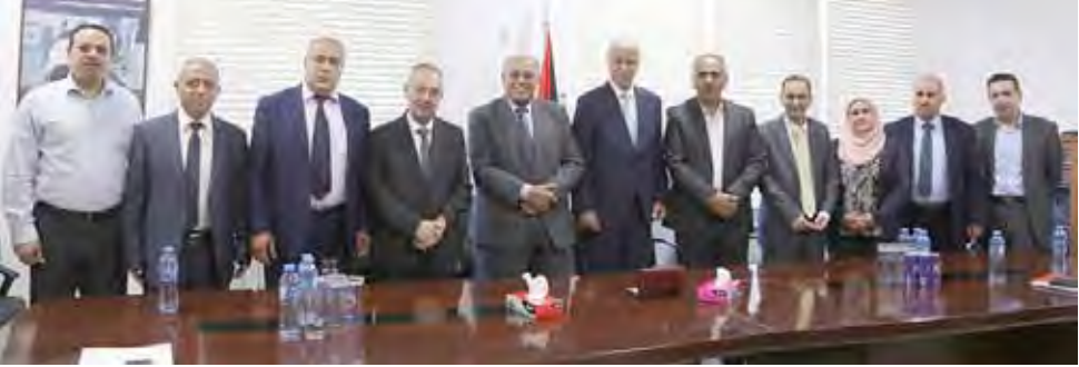
الموقعون على الاتفاقيات.

وشدد على ضرورة متابعة هذا الجهد النوعي والبناء عليه بما يترجم روح الشراكة لخدمة التعليم.