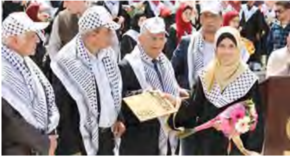
جانب من حفل التكريم.