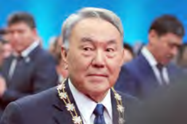
رئيس كاراخستان المستقبل نور سلطان نزارباييف.

اقتصادها الذي يعتمد كثيرا على النفط. وقد انتهى هذا الإعلان المفاجئ ولاية رئيس الوزراء باكتيجان ساغينتايف الذي كان يعتبر خليفته المتمم في الانتخابات الرئاسية في ٢٠٢٠. وكان الرئيس وعد آنذاك باتخاذ تدابير اجتماعية تبلغ نفقاتها مليارات عدة من اليورو، للرد على الاستياء المتزايد للناس، قبل أقل من سنة على الانتخابات الرئاسية المقبلة. وتعد كاراخستان، الغنية بالنفط والغاز، والمنتج العالمي الأول لليورانيوم، والأكبر أربع مرات من فرنسا. أكبر اقتصاد في آسيا الوسطى. لكن هذا البلد الذي يبلغ عدد سكانه ١٨ مليون نسمة، يعاني منذ ٢٠١٤ من تراجع أسعار النفط والأزمة الاقتصادية لدى حليفه الروسي، والتي تسببت في تراجع قيمة عملة البلاد.