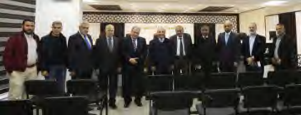
وفد "القدس المفتوحة" خلال زيارته مقر المحكمة الدستورية.

رام الله - الأيام"؛ بحث رئيس جامعة القدس المفتوحة يونس عمرور، مع رئيس المحكمة الدستورية الفلسطينية، المستشار محمد الحاج قاسم، خلال لقاء في رام الله، أمس، آليات التعاون المشترك بين الجانبين، لتطوير وتأهيل الكادر القانوني والإداري والعمل على تلبية احتياجات المحكمة الدستورية لتأهيل كوادرها بمختلف المجالات. وقال الحاج قاسم: لـ "القدس المفتوحة" إنجازات عديدة، ونسعى لأن توفر لنا الجامعة الخبرة فيما يتعلق بالاحتياجات التدريبية لموظفي المحكمة خاصة بمجالات تكنولوجيا المعلومات والاتصالات.