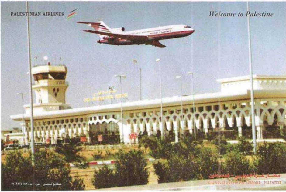
صورة ارشيفية للمطار.

ويقع مطار غزة الدولي أو (مطار ياسر عرفات) في محافظة رفح على الحدود مع مصر، ويضم مدرج هبوط وإقلاع، واحد بطول يبلغ 3080 متراً، وعرض