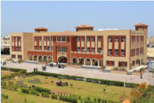
6. مبنى فرع رفح: المساحة 8920 م 2 .