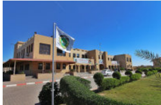
3. مبنى فرع خان يونس: المساحة 2400 م 2 .