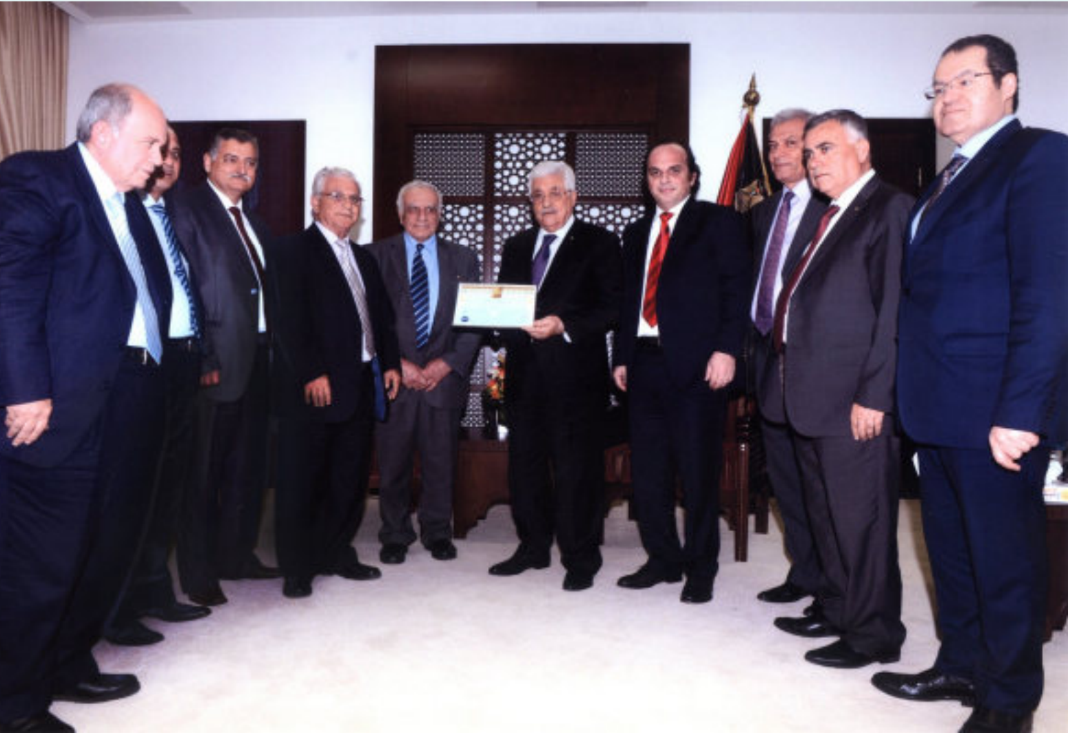
القدس المفتوحة تهدي سيادة الرئيس محمود عباس جائزة القرن الذهبي