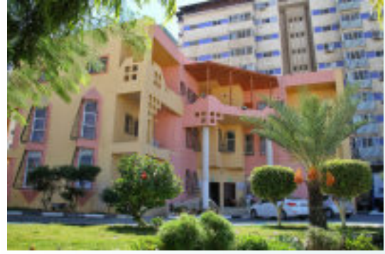
1. مبنى الإدارة العامة في غزة: المساحة 850 م 2 .