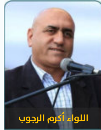
اللواء أكرم الرجوب