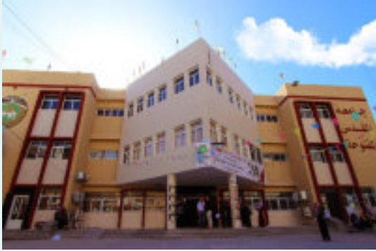
2. مبنى فرع غزة: المساحة 6500 م 2 .