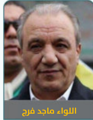
اللواء ماجد فرج