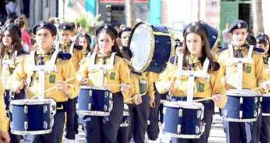
جانب من الاحتفال بوصول موكب حارس الأراضي المقدسة إلى بيت لحم.