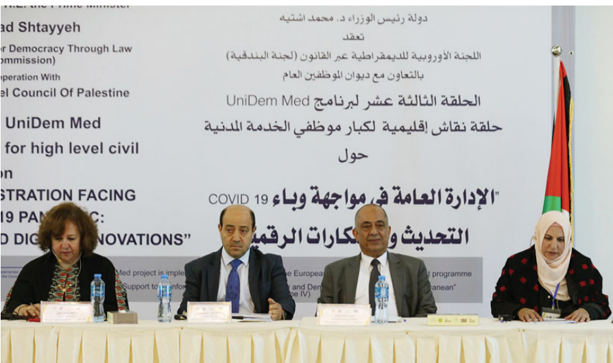
دولة رئيس الوزراء، د. محمد اشتية

تعقد اللجنة الأوروبية للديمقراطية عبر القانون (لجنة البندقية) بالتعاون مع ديوان الموظفين العام