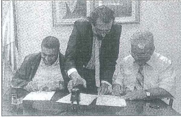
جانب من توقيع الاتفاقية مع " الجامعة المفتوحة "