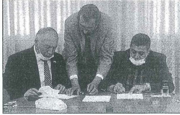
جانب من توقيع الاتفاقية مع " جامعة الخليل "