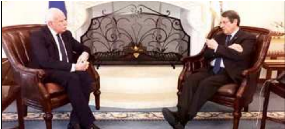
المالكي خلال لقائه الرئيس القبرصي في نيقوسيا.

وأكد الوزيران أهمية الدعم والتعاون والتنسيق المشترك في جميع المجالات وعلى المستويات كافة، واتفاق على عقد مشاورات سياسية قريباً، وتم توقيع بروتوكول المشاورات